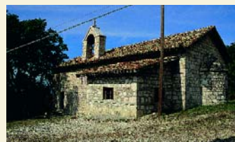
S. Vito. Chiesa S. Maria