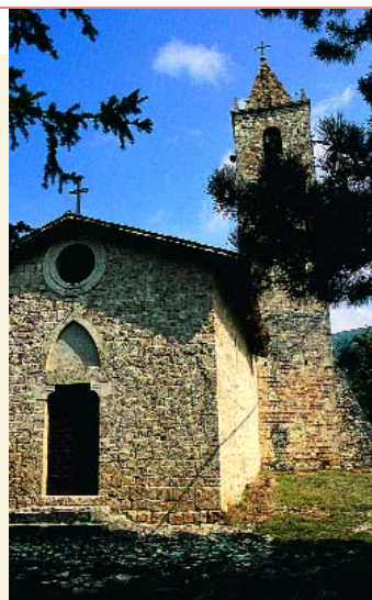
Cesano. Chiesa S. Rufina