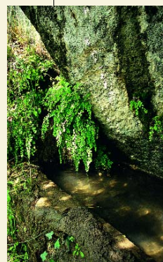
S. Vito. Lavatoto