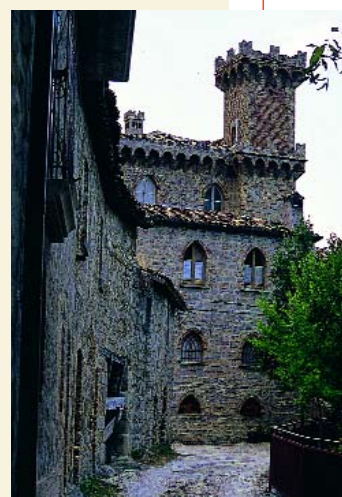
Vallenquina. Castel Bonifaci

Poiché è inevitabile fare riferimento al fenomeno del brigantaggio nei Monti della Laga, non come spunto folcloristico ma come espressione dello storico disagio sociale delle comunità montane, occorre ripercorrere brevemente la storia