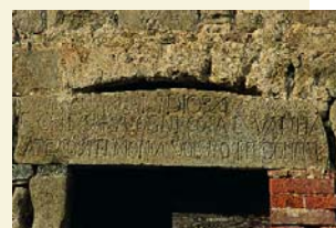
Fornisco. Architrave in pietra scolpita