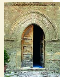
Valle Castellana. Chiesa SS. Annunziata